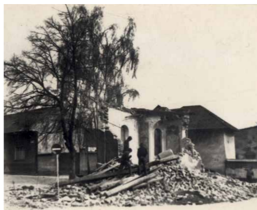
Kaple sv. Josefa na řepčinské návsi ... a její bourání v 50. letech

hřbu místního hasiče z roku 1935. Za minulého režimu však svatí neměli velkou šanci. Kaple byla na příkaz místního funkcionáře zbourána a cihly byly využity k soukromým účelům. Štěstí však nepřinesly, ten který likvidaci památky zavinil, do roka zemřel.