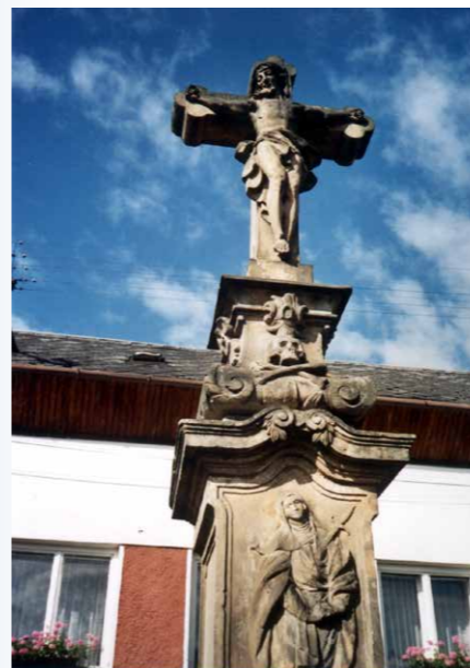
Kamenný kříž v Řepčinské ulici z r. 1804

V Řepčinské ulici stojí pěkný kamenný kříž s ukřížováním Krista z roku 1804. Na podstavci má reliéf Panny Marie Bolestné a lebku se zkříženými hnáty.