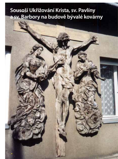
Sousoší Ukřížování Krista, sv. Pavliny a sv. Barbory na budově bývalé kovárny