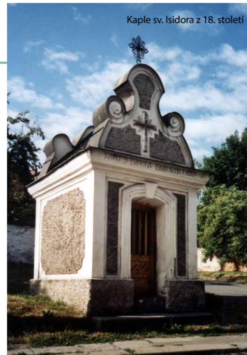
Kaple sv. Isidora z 18. století

s Břetislavovou ulicí stávala až do sedmdesátých let minulého století malá kaple s věží zasvěcená sv. Josefovi. Byla postavená počátkem 20. století. Zasvěcení mohlo souviset s rozšířením továrny, protože svatý Josef je patronem dělníků, tesařů a tovaryšských spolků, ale je i patronem umírajících. Konala se zde poslední rozloučení s mrtvými, jak dokládá obrázek po-