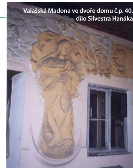
Valašská Madona ve dvoře domu č.p. 40, dílo Silvestra Hanáka

na neředínský hřbitov. Další smírčí kámen stál údajně i u jednoho z rybníků u cesty ke Křelovu.