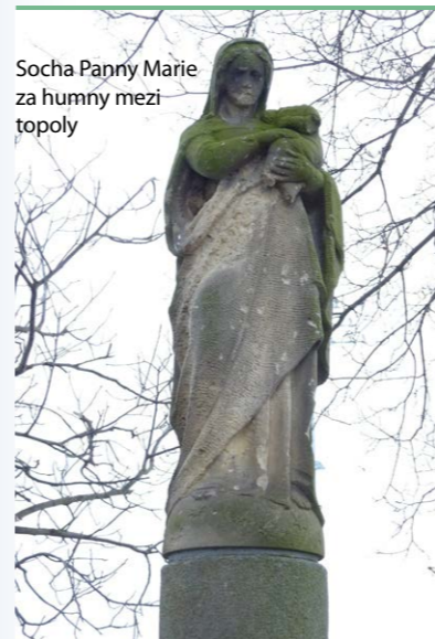
Socha Panny Marie za humny mezi topoly