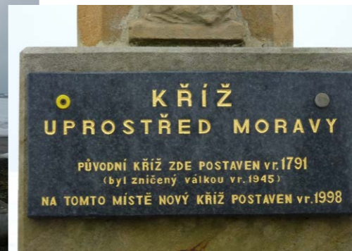
Deska na Kříži uprostřed Moravy

čeným a šesti místním občanům padlým při osvobozeních bojích.