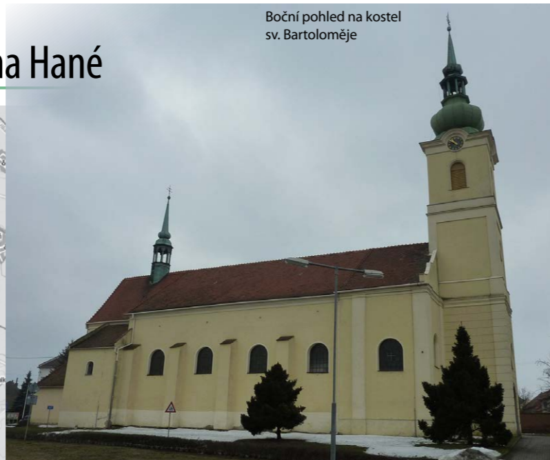
Boční pohled na kostel sv. Bartoloměje