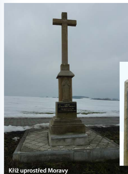
Kříž uprostřed Moravy

Poslední kamenný kříž stojí na hřbitově mezi hroby. Najdeme zde také pomník s hrobem 10 rumunských vojáků, padlých při osvobození obce a pomník obětí druhé světové války věnovaný osmi umu-