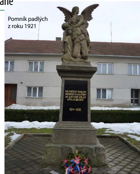
Pomník padlých z roku 1921

při dopravní nehodě. Naposledy jej vystavěli bratři Vysloužilové v roce 1998. Je označen jako Kříž uprostřed Moravy. Podle místní pověsti předpovídala kdysi věštka, že na Moravě bude velká válka, která skončí mezi černým a bílým městečkem. O Pivínu se říkalo, že je černým městečkem a Kralice na Hané mají přezdívku Bílé městečko. Na konci války v květnu 1945 se přesně zde zastavila fronta, když ruské tanky útočily směrem na Prostějov. Pět z nich skončilo mezi obcemi v prohlubni u potoka. 8. května o půlnoci zde skončila válka přesně mezi Pivínem a Kralicemi.