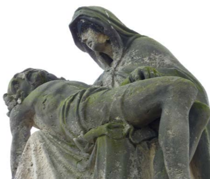
Detail Piety z r. 1913 v poli k Čelčicím

Zajímavý osud má místo kříže u silnice mezi Klenovicemi a Čelčicemi. Původní kříž pocházející z roku 1791 byl zničený v bojích v květnu 1945. Potom byl dvakrát obnovený, ale vždy zničený vandaly nebo