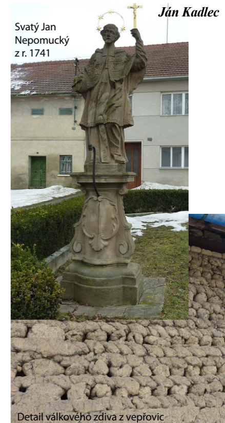
Svatý Jan Nepomucký z r. 1741

lit říci králi i věci, které král nerad slyšel. Vesnice Klenovice si zkusila hodně zlého mezi prvním a osmým květnem 1945, kdy se zde v bojích střídaly ruská a německá armáda. Válečné škody však byly zahrazeny a dnes je to kvetoucí vesnice, odkud si můžete odnést pěkné zážitky z objevování místních památek. Jen musíte dávat pozor na bezedné tůně kolem Valové! Já jsem si odnesl bažantí pírkem na památku. Mohlo by se hodit k zastrčení do klobouku nebo do šaškovské čepice.