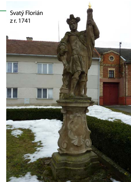
Svatý Florián z r. 1741

Podle pověsti z Klenovic pocházel bratr Paleček – šašek krále Jiřího z Poděbrad, který se opravdu psal jako Klenovský. Rozdával smích i moudra a mohl si dovo-