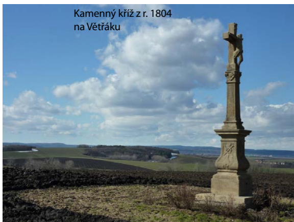
Kamenný kříž z r. 1804 na Větráku

Další památky najdeme na návsi. Patří k nim pěkný soubor dvou barokních soch svatých a to sv. Jana Nepomuckého a sv. Floriána, které stály původně u kostela. Obě jsou chráněné jako nemovité kulturní památky a pocházejí z roku 1741. Mezi nimi stojí velmi pěkný pomník padlých v I. světové válce se sochou anděla sklánějícího se nad umírajícím vojáčkem. Je na něm 26 jmen padlých a odhalen byl v roce 1921. Původně u něj byli pohřbeni sovětské vojáci, kteří potom byli exhumováni.