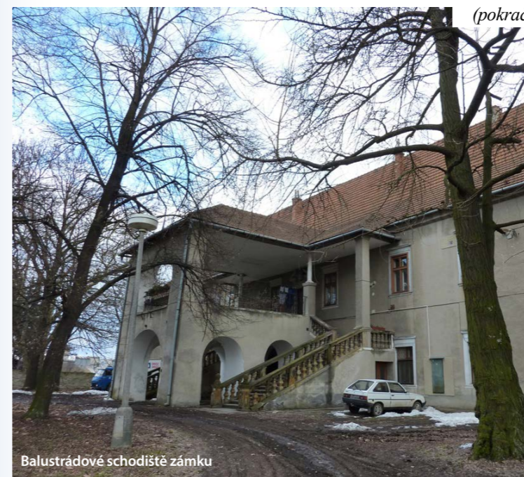
Balustrádové schodiště zámku