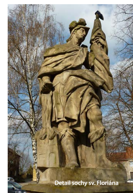
Detail sochy sv. Floriána