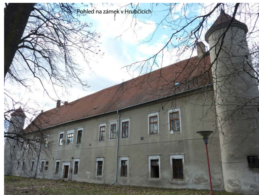
Pohled na zámek v Hrubčicích