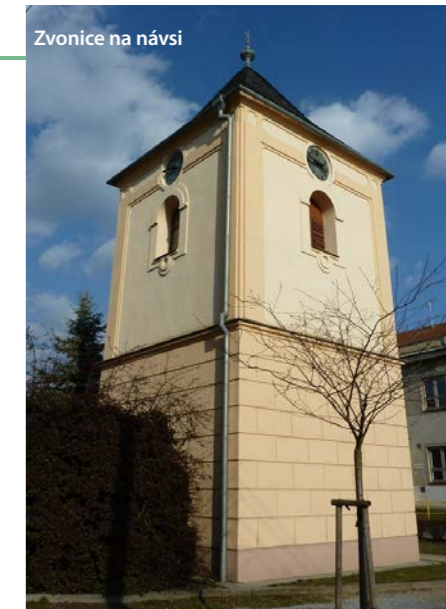
Zvonice na návsi