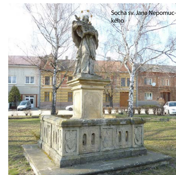
Socha sv. Jana Nepomuckého