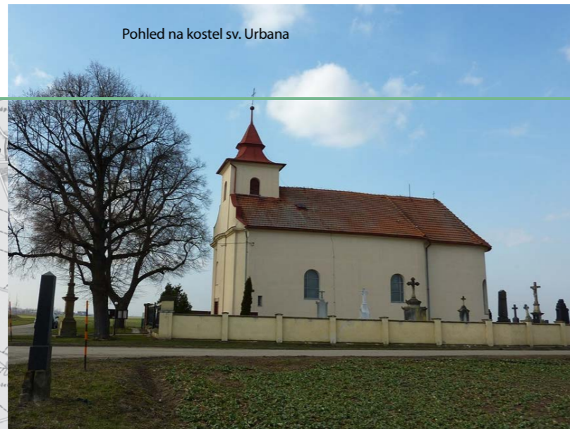
Pohled na kostel sv. Urbana

Vesnici Hrubčice najdeme u silnice z Prostějova do Tovačova, leží asi 6 kilometrů východně od centra Prostějova. Její poměrně velký katastr má oválný tvar, přibližně v polovině jej dělí terénní zlom, pod nímž dříve tekla mlýnský náhon. Dole u levého břehu Valové byly louky, občas zaplavované při povodních, nahoře na sprašové planině jsou úrodná pole. Katastr je bezlesý, dnes jej tvoří rozsáhlé lány zemědělské půdy, v posledních letech tu byly vybudovány biokoridory s vysazenou zelení stromů a keřů a je zde také farma slunečních kolektorů. Dnes patří k Hrubčicím i menší vesnice Otonovice, která byla dříve samostatná a jejíž památky popíšeme v příštím díle. Okolí tvoří stará sídelní oblast, jsou tu bohaté nálezy žárovných hrobů lidu lužické kultury a kultury zvoncových pohárů.