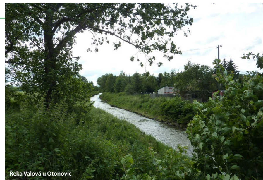
Řeka Valová u Otonovic

provázek na zvonek ve zvonici a po korunách lip, které tehdy rostly na návsi, jej vedli až na konec vesnice. Tam se schovali do příkopu a v hluboké noci zvonili. Poprvé, jako že hoří – lidé vyběhali, ale nic nezjistili, podruhé zvonili proti bouři a kroupám, zase nic – obviněn byl zvoník a potřeť, když utrhli provaz, aby se na ně nepřišlo. Celá vesnice byla na nohou, vyslyšeli zvoníka, ale na nic nepřišli. Čehovští se přiznali až později a celé okolí se prý otonovickým smálo.