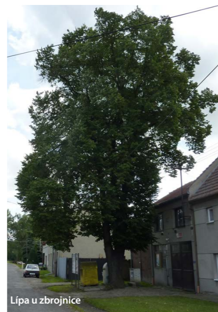
Lípa u zbrojnice