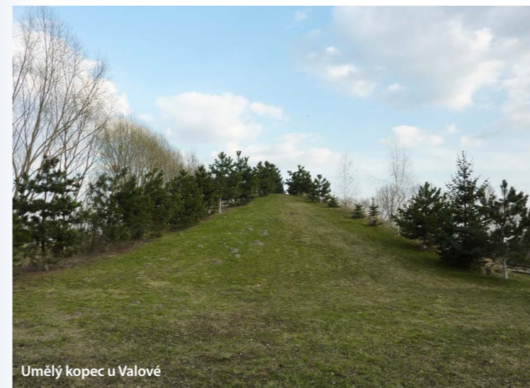
Umělý kopec u Valové