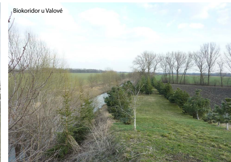
Biokoridor u Valové