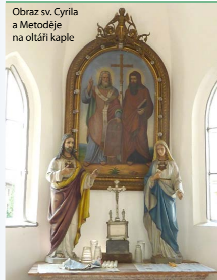
Obraz sv. Cyrila a Metoděje na oltáři kaple