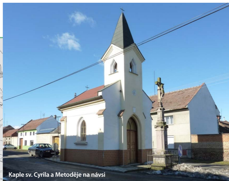
Kaple sv. Cyrila a Metoděje na návsi

Otonovští ragani snědle koňa za dva dni, neměle ho dosti snědle ai kosti