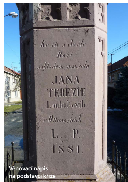
Věnovací nápis na podstavci kříže