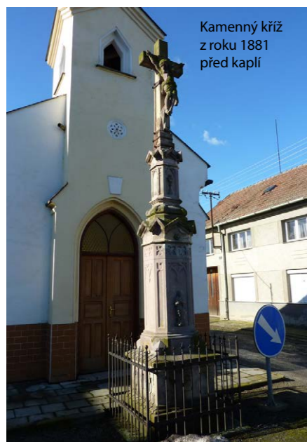
Kamenný kříž z roku 1881 před kaplí