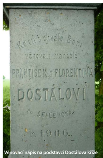
Věnovací nápis na podstavci Dostálova kříže