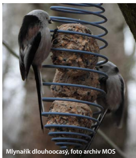
Mlynařík dlouhoocasý