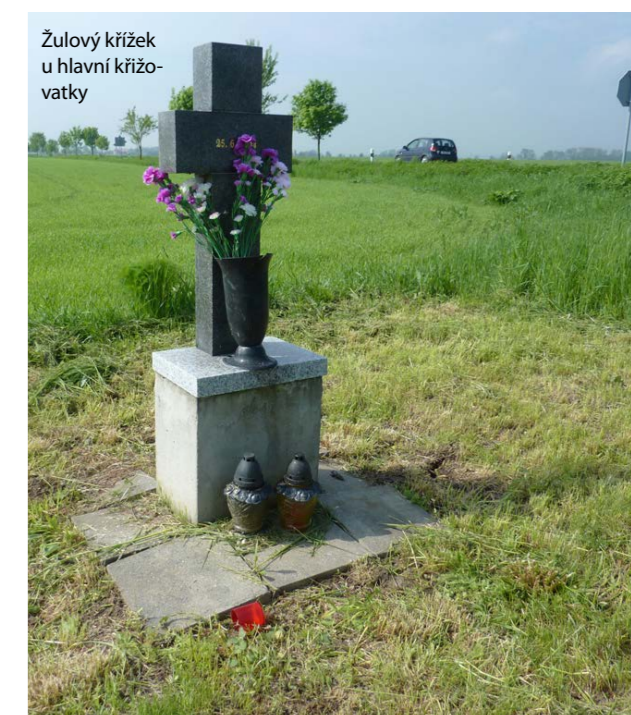
Žulový křížek u hlavní křižovatky