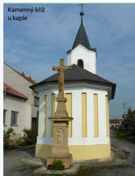
Kamenný kříž u kaple