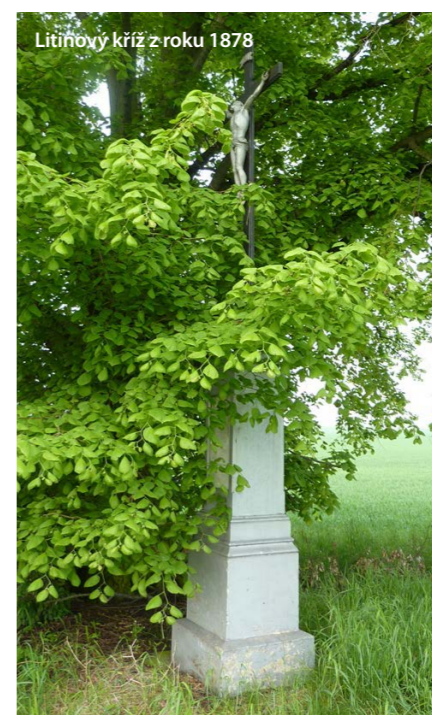
Litinový kříž z roku 1878