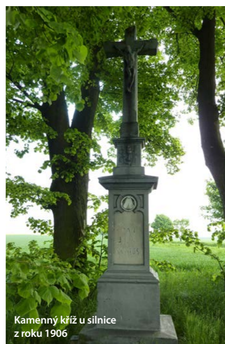
Kamenný kříž u silnice z roku 1906