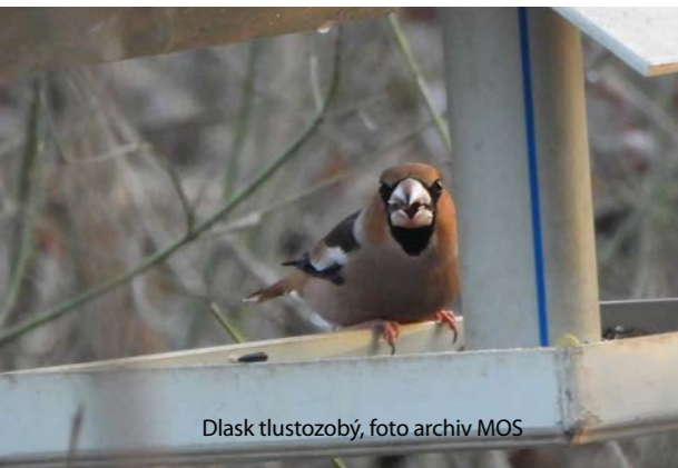
Dlask tlustozobý

Na sobotní pozorování na Annínském jezeře, které je součástí mokřadů kolem Tovačova, zve vedoucí akce Patrik Spáčil: "V zimě se tu shromažďují početná hejna kachen včetně vzácných morčáků malých nebo ostralek štíhlých, hejna běžných i raritních racků, jsou zde kormoráni velcí, labutě nebo potáplice. Snad toho uvidíme co nejvíce." Sraz zájemců je na pláži na severní straně jezera v 10:15 hodin, na místo se lze dostat linkovým autobusem z Přerova, Kojetína i z Olomouce.