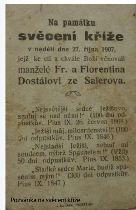
Pozvánka na svěcení kříže