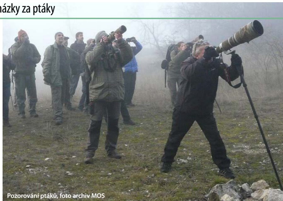
Pozorování ptáků, foto archiv MOS

PŘEROV/TOVAČOV - O prvním únorovém víkendu pořádá Česká společnost ornitologická (ČSO) po celém Česku sérii tematických vycházek s pozorováním vodních ptáků. Právě na neděli 2. února totiž připadá Světový den mokřadů, připomínající důležitost ochrany těchto biotopů pro přírodu i člověka. Moravský ornitologický spolek se jako součást ČSO k sérii těchto akcí připojuje svými dvěma exkurzemi. V sobotu 1. února mohou zájemci navštívit s ornitology Annínské jezero u Tovačova a v neděli 2. února přírodní památku Malé laguny v Přerově.