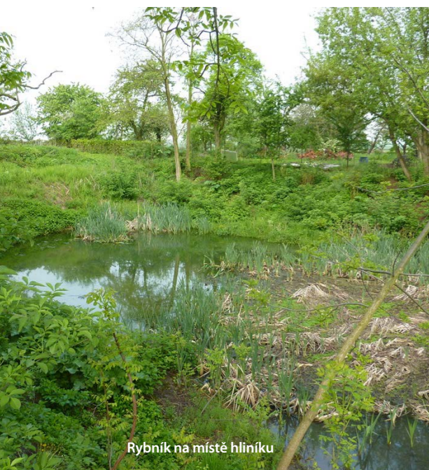
Rybník na místě hliníku