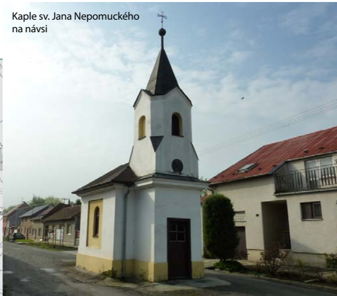
Kaple sv. Jana Nepomuckého na návsi

Nejvýznamnější památkou Kraliček je malá úhledná kaple, zasvěcená sv. Janu Nepomuckému. Kaple se zvonící byla postavena v roce 1881 nákladem 700 zlatých, získaných od občanů. Uvnitř je na oltáři soška svatého Jana Nepomuckého. Kaple prošla v roce 1995 celkovou rekonstrukcí, tehdy získala novou izolaci, střechu a okapy.