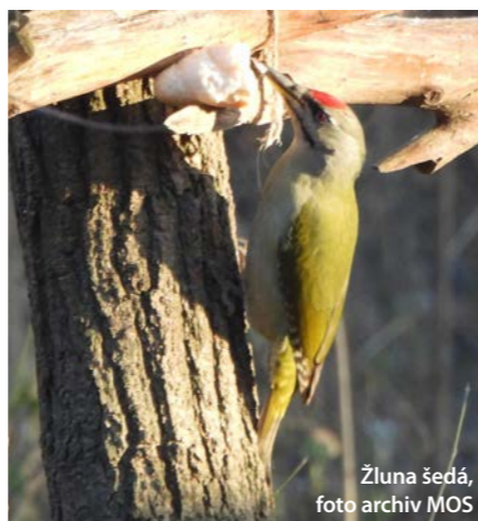
Žluna šedá

Moravský ornitologický spolek – středomoravská pobočka ČSO je nevládní nezisková organizace sdružující profesionální i amatérské ornitology, birdwatchery, milovníky ptáků a ochránce přírody. Realizuje projekty na výzkum a ochranu ptáků, popularizaci ornitologie, ekologickou výchovu a osvětu.